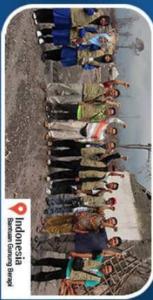
Indonesia Bantuan Gunung Berapi